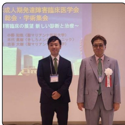
〔木代院長〕 ショートケアに通所中の方の治療経過を通して、治療に必要なことを発表しました。

7月に「日本成人期発達障害臨床医学会（横浜大会）」、9月に「成人発達障害支援学会（大阪大会）」に参加してきました。ぶどうの樹の支援を知ってもらうことができましたし、そこで助言やコメントをいただくことは日々の支援を見直すとても良い機会になりました。研究にご協力いただいた方、発表にご承諾いただいた方に改めて感謝申し上げます。