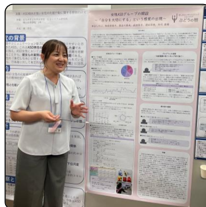
〔米谷心理士〕 女性ASDグループの実践についてポスター発表を行いました。