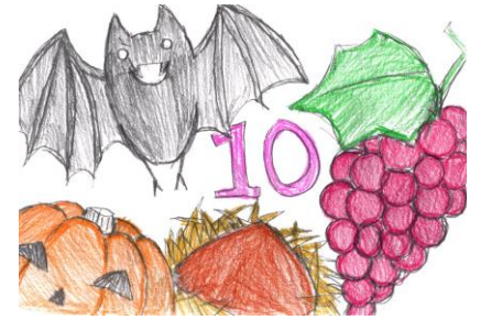
通所者さんが描いたイラストです