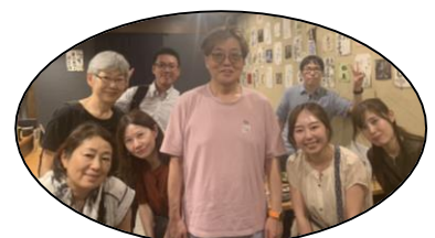
少しでも観光も楽しめました！