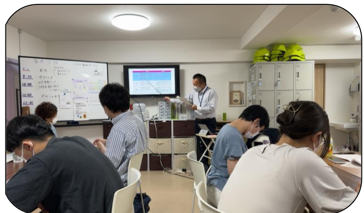
就労移行支援事業所の職員さんに「障害者雇用の現状」についてお話をいただきました。今年の4月より民間企業の法定雇用率が引き上げられたことなど、多くのことを学びました。