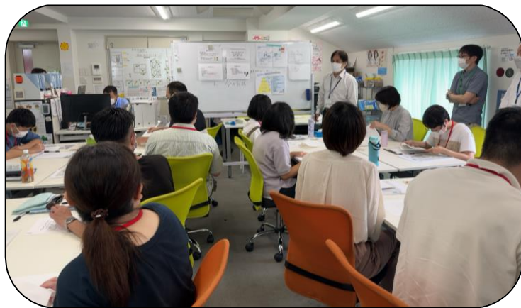
8月に就労移行支援事業所へ見学に行ってきました。事業所に通所している方々とも交流することができ、とても貴重な体験ができました。お昼のお弁当も美味しかったです！

精神科ショートケアグループの中には、就労や就労関係の支援へのステップアップを目指している方を対象とした「就労準備グループ」があります。このグループは事業所見学を行ったり、事業所の方から出張授業を行っていただいたりと、より実践的な形で就労をイメージできるようにグループを行っております。