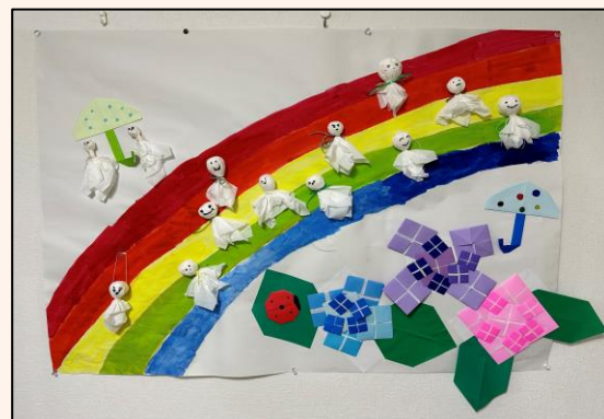
梅雨のグループ制作

普段なかなか遠出ができない方や、一緒に楽しみたい方々を募り、年2回1日外出を行っています。5月の行先は小田原に行きました！新合ヶ丘で待ち合わせ、ロマンスカーに乗って移動しました。移動中はカードゲームを持参したメンバーの声掛けでゲームをしたり、お菓子を食べながらおしゃべりしたりと、各々の時間を過ごしました。小田原では小田原城探索や、海へ行って貝殻拾ったり波音に癒されたりと充実した1日を過ごしました。次回は11月です。行先は絶賛企画中です！