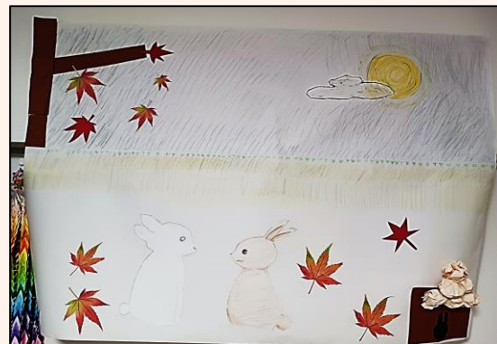
秋のグループ制作