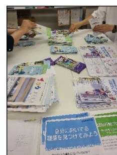
就労移行支援事業所ルミノーズ 川崎登戸軽作業実践の様子です♪